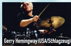
Gerry Hemingway (USA/Schlagzeug)

Wie Yang Jing ist der amerikanische Perkussionist Gerry Hemingway ein Virtuose mit breitem Hintergrund – von Neuer Musik über World Music bis zu Swing. Zusammen verwenden sie das alte chinesische Konzept der fünf Elemente als Thema für Improvisationen. Und entführen auf eine musikalische Reise der Sinnsuche.